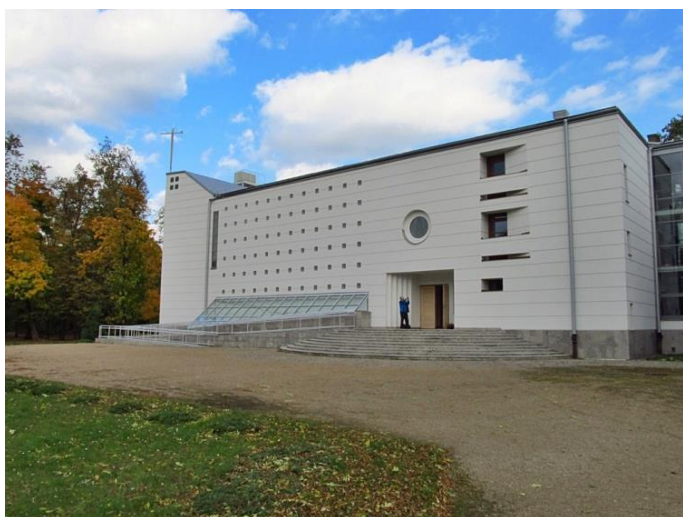
Sanktuarium MB Jazłowieckiej w Szymanowie

Szymanów należy do najstarszych miejscowości na terenie gminy Teresin. Nazwa Szymanów pochodzi prawdopodobnie od imienia Szymon lub Szyman. W najstarszych źródłach występuje pod nazwą Szymanowo lub Szymonowo. Do I połowy XV wieku należał do książąt mazowieckich. W 1435 roku nabył go od księcia Ziemowita V, stolnik sochaczewski Abraham Pawłowski z Gnatowic. Następnymi właścicielami byli Szymanowscy, którzy prawdopodobnie przejęli nazwisko od nazwy miejscowości. W XVI wieku właścicielem wsi był Mikołaj Maciejewski. Na przełomie XVI i XVII wieku stała się własnością Myszkowskich. Pierwszy zamiar fundacji kościoła w 1444 roku nie doszedł do skutku. Świątynię wzniesiono w 1667 roku staraniem starosty guzowskiego, golubskiego i grzybowskiego Mikołaja Wiktoryna Grudzińskiego. Początkowo świątynia była filią parafii Stare Wiskitki. Osobna parafia w Szymanowie wyodrębniona została w 1776 roku. Przy kościele pobudowano szpital, w którym mieszkał organista, mieścił się przytułek i parafialna szkoła. Kolejnymi właścicielami Szymanowa byli m.in. Sanguszkowie, Kronenbergowie i Lubomirscy.