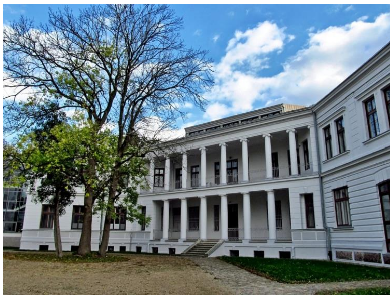
Klasztor Sióstr Niepokalanek

Szymanów należy do najstarszych miejscowości na terenie gminy Teresin. Nazwa Szymanów pochodzi prawdopodobnie od imienia Szymon lub Szyman. W najstarszych źródłach występuje pod nazwą Szymanowo lub Szymonowo. Do I połowy XV wieku należał do książąt mazowieckich. W 1435 roku nabył go od księcia Ziemowita V, stolnik sochaczewski Abraham Pawłowski z Gnatowic. Następnymi właścicielami byli Szymanowscy, którzy prawdopodobnie przejęli nazwisko od nazwy miejscowości. W XVI wieku właścicielem wsi był Mikołaj Maciejewski. Na przełomie XVI i XVII wieku stała się własnością Myszkowskich. Pierwszy zamiar fundacji kościoła w 1444 roku nie doszedł do skutku. Świątynię wzniesiono w 1667 roku staraniem starosty guzowskiego, golubskiego i grzybowskiego Mikołaja Wiktoryna Grudzińskiego. Początkowo świątynia była filią parafii Stare Wiskitki. Osobna parafia w Szymanowie wyodrębniona została w 1776 roku. Przy kościele pobudowano szpital, w którym mieszkał organista, mieścił się przytułek i parafialna szkoła. Kolejnymi właścicielami Szymanowa byli m.in. Sanguszkowie, Kronenbergowie i Lubomirscy.